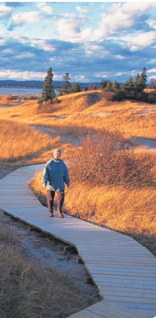
Les dunes de sable — Serge Paré